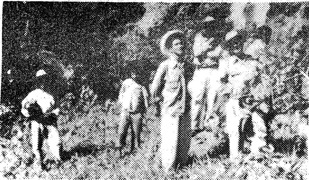
Recorriendo con maestros y campesinos zonas rurales de Venezuela.

caballos a la huerta" escribió, marcando para siempre a las autoridades de la época y sus consejeros "técnicos", su apoyo permanente al I.C.E.R. (entidad fundada por los maestros rurales) son algunos de los hechos que testimonian ese protagonismo.